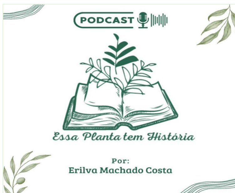
Figura 4: Template capa do Podcast

Fonte: COSTA (2022). Plataforma de design gráfico Canva , 2.184.0, versão gratuita.